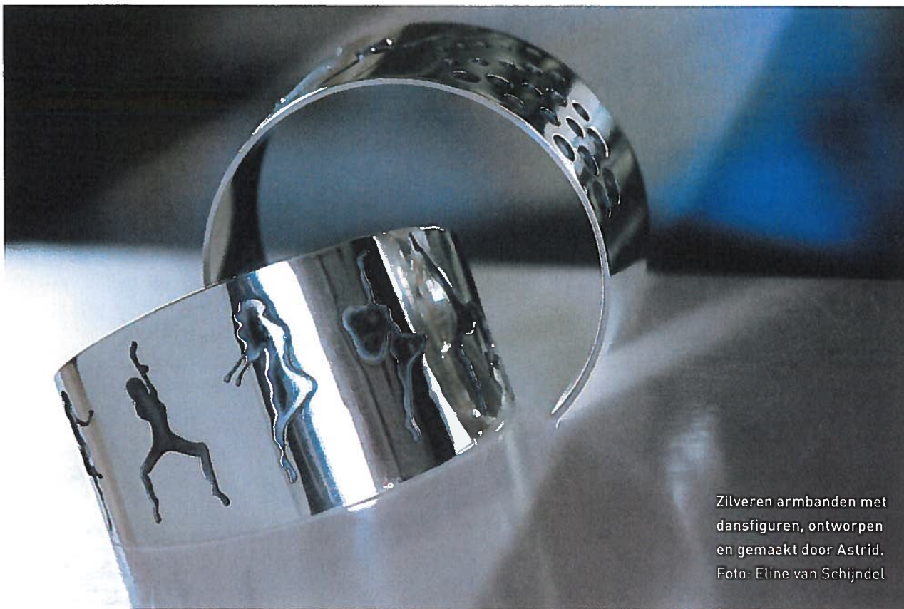
Zilveren armbanden met dansfiguren, ontworpen en gemaakt door Astrid. Foto: Eline van Schijndel